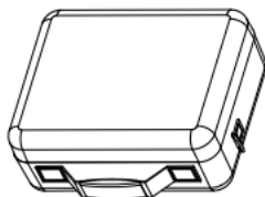
Carrying case (x1)