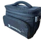
HM-SP01-POUCH M/G/SP Series Pouch