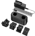
HM-5202ZC2 G Series Charging Base